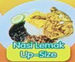
Nasi Lemak Up-Size