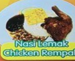
Nasi Lemak Chicken Rempah