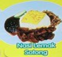
Nasi Lemak Sotong