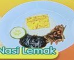
Nasi Lemak Chicken Wing