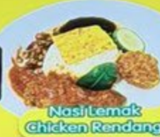
Nasi Lemak chicken Rendang