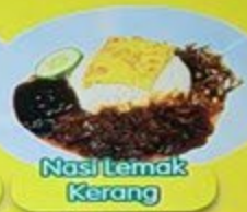
Nasi Lemak Kerang