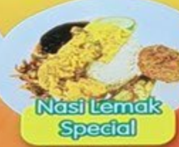
Nasi Lemak Special